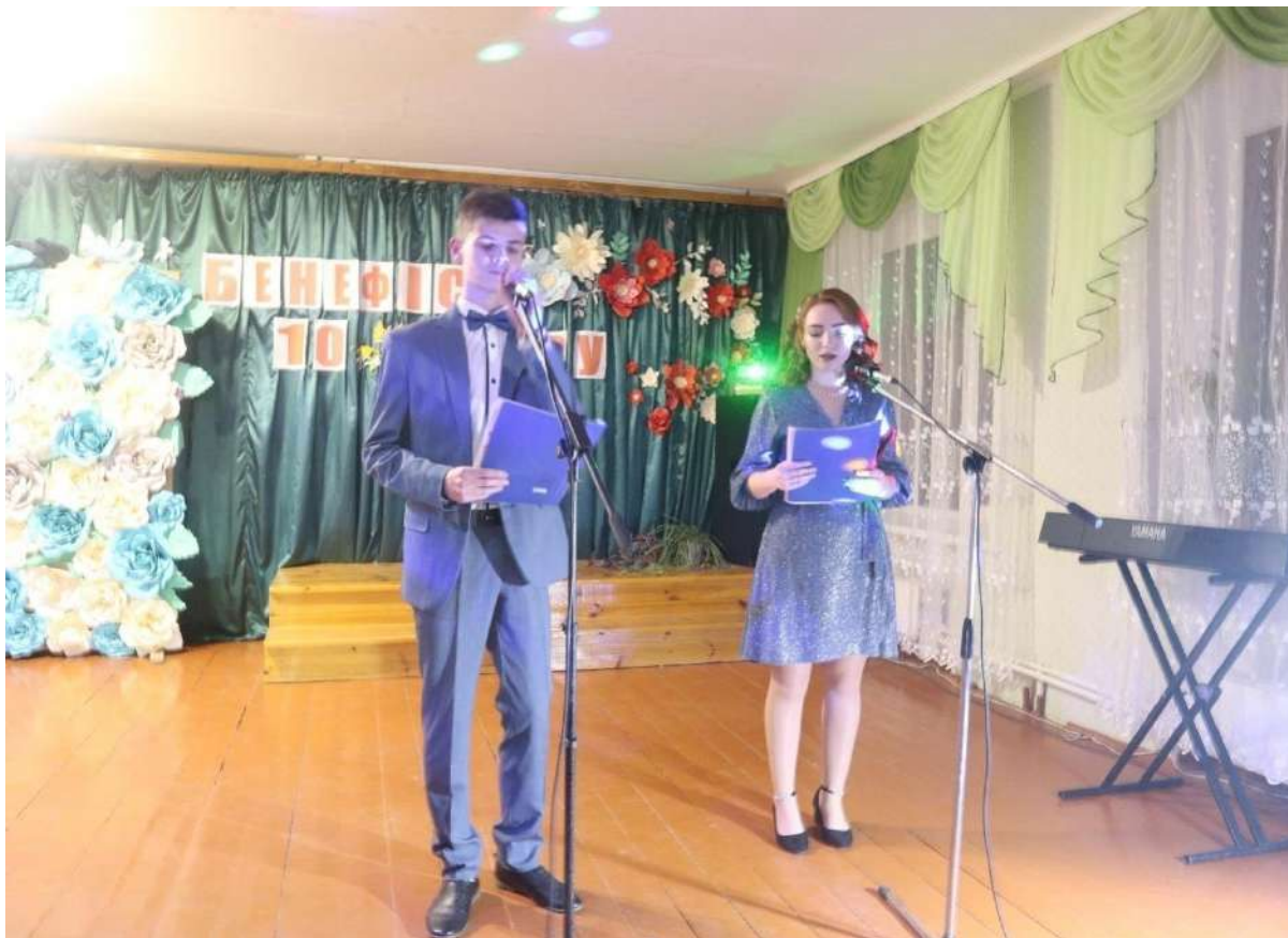
Бенефіс 10 класу