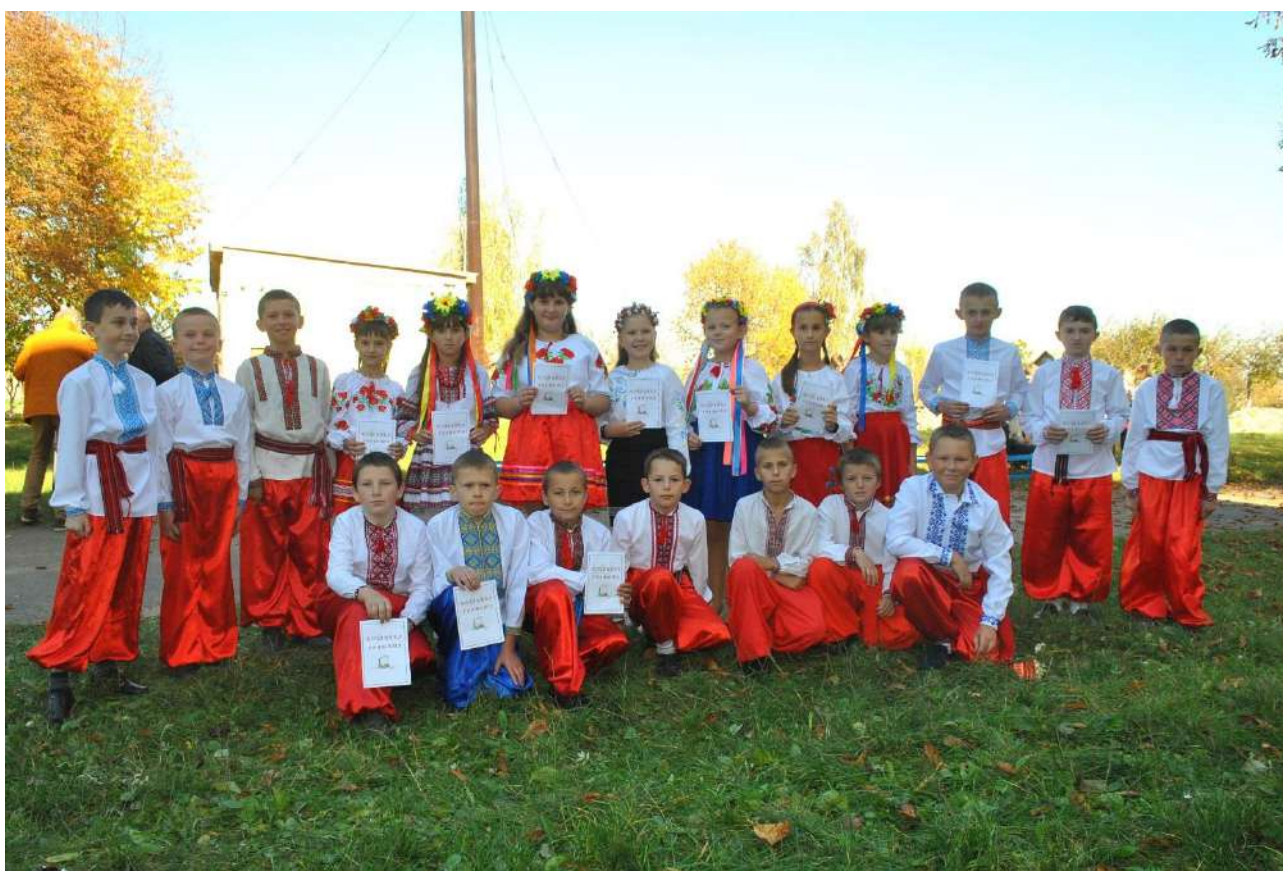
Посвята в козачата