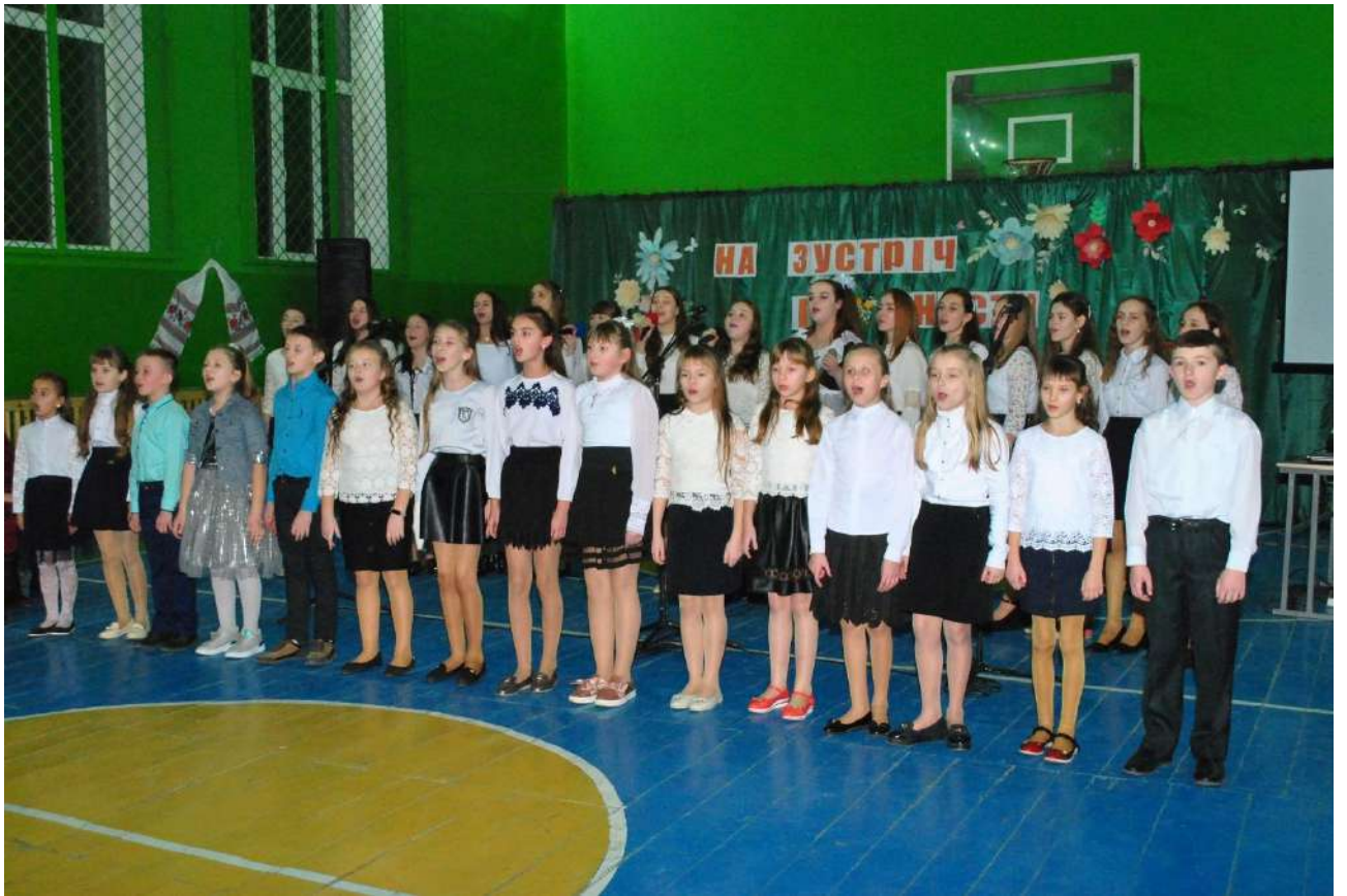
Зустріч з випускниками