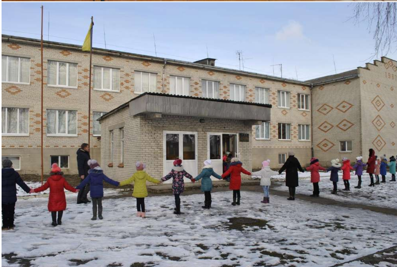
Флешмоб до Дня Соборності «Обійми школу»