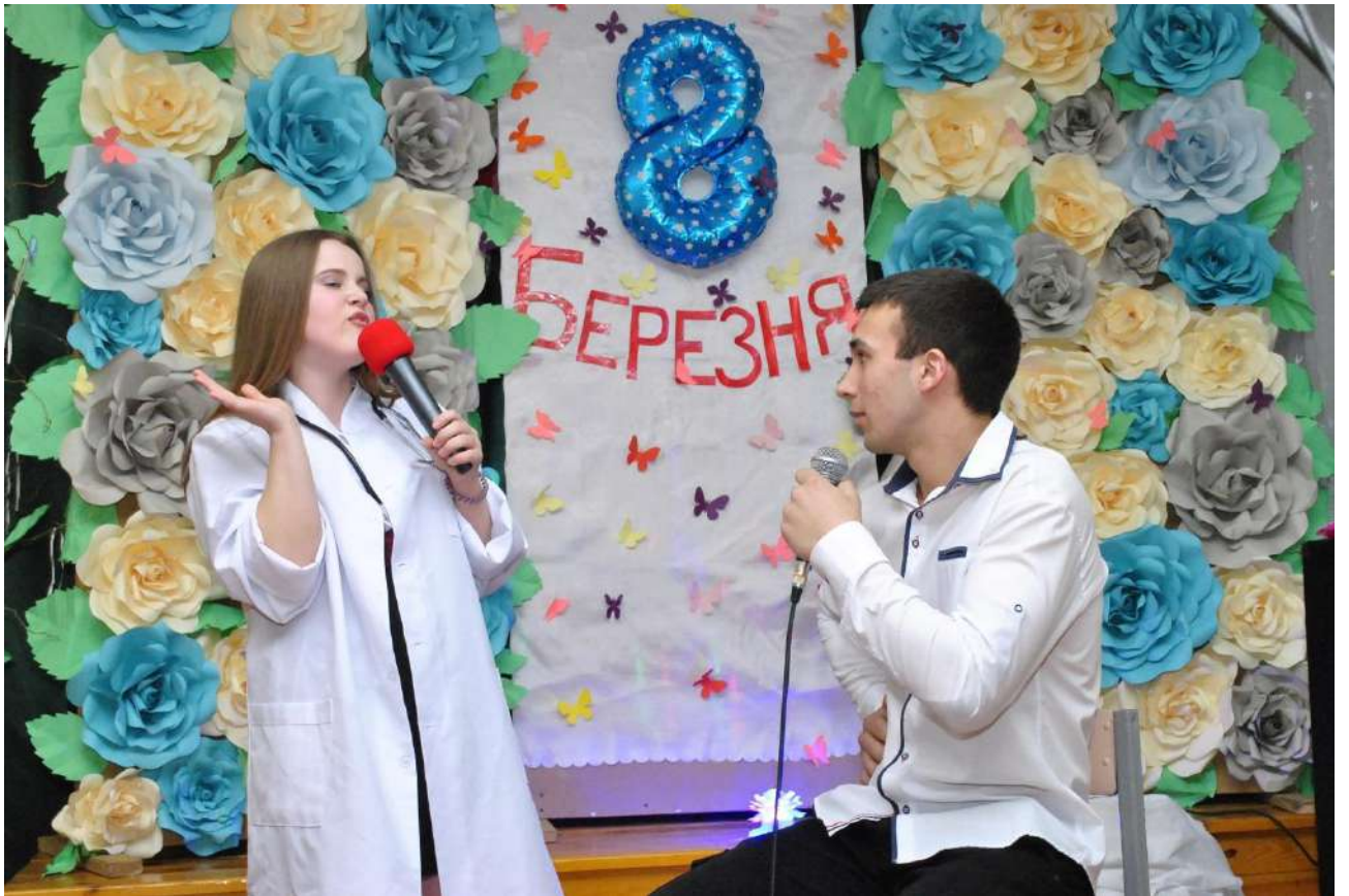
Вітаємо з 8 Березня